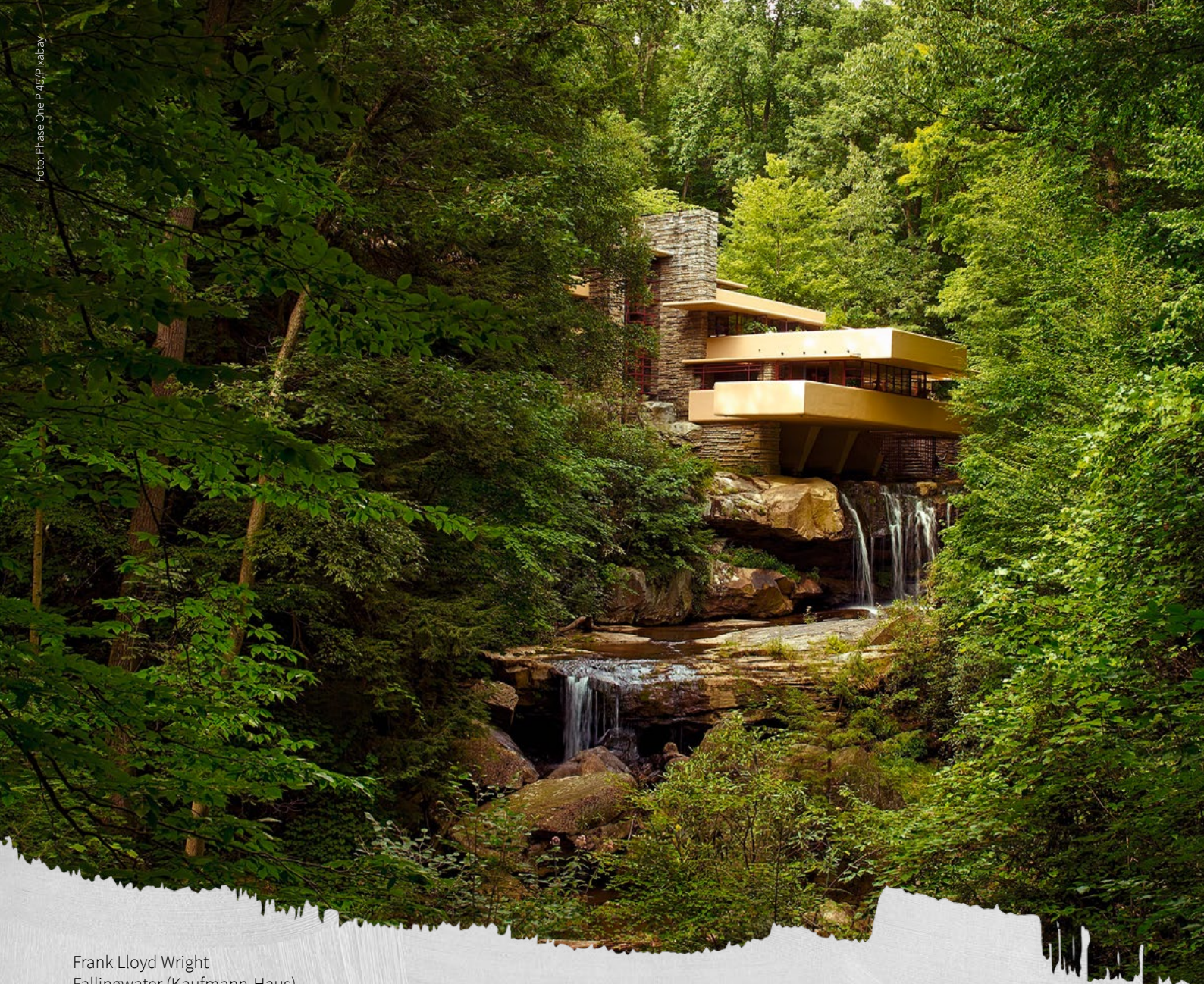
Frank Lloyd Wright Fallingwater (Kaufmann-Haus)

Mensch gestaltet seine Umgebung, aber er wird seinerseits wiederum geprägt von genau dieser umbauten Umgebung, die er sich darüber hinaus zumindest im Kindesalter, im wichtigsten Entwicklungsstadium des Menschen also, nicht aussuchen kann. Die Sozialisation ist eben eine elementare Komponente menschlicher Bildung und findet ihren alltäglichen Ort regelmäßig im umbauten Raum.