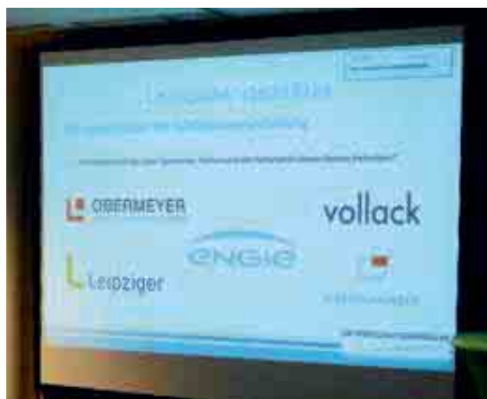
Der Dank gilt den Unterstützern dieser Veranstaltung!

gerichtet an uns alle: Inwieweit sind wir denn bereit, wirklich auch für das, was wir tun, was wir denken, wie wir handeln, auch wirklich Verantwortung zu übernehmen? Und uns nicht zurückziehen und zu sagen: Hanemann geh du mal voran. Oder irgendein Kollektiv für unser Handeln verantwortlich zu machen. Schwierige Frage, unglaublich schwierige Frage vor allem für jene, die Repräsentanten sind in Unternehmen, und die Verantwortung tragen und die Verantwortung übernehmen müssen. Gerade im Zusammenhang zum Beispiel mit finanzwirtschaftlichen Fragen